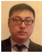
向 陽 こう よう