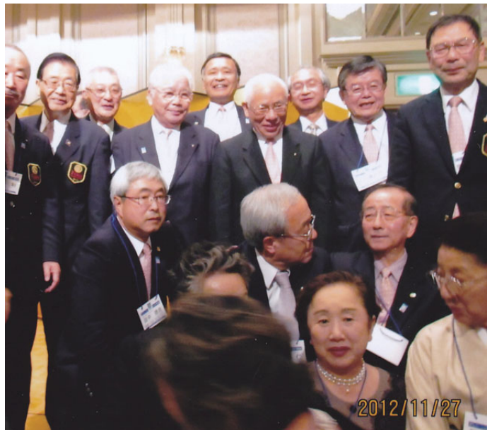
2012年11月第41回ロータリー研究会にて

時節柄、寒い毎日が続く事でしょう。健康が一番です。決して無理をなさらないよう願っております。再会を楽しみにしております。