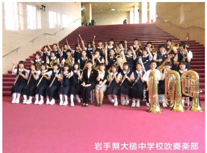
岩手県大槌中学校吹奏楽部