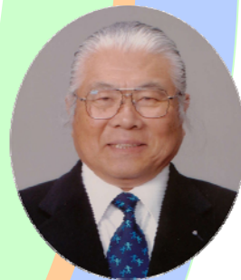
ガバナー 平原 祥彰